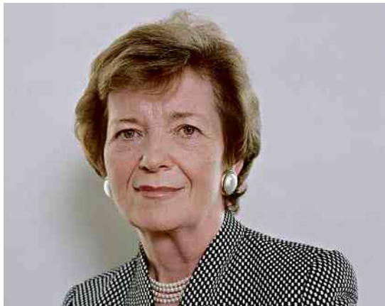
A ex-presidente da Irlanda Mary Robinson, que vem ao país

“Temos que estar muito mais atentos em administrar bem os fluxos migratórios e preservar os direitos dos refu-