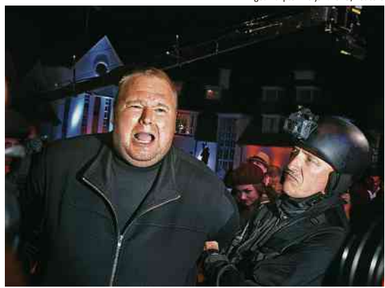
Ator finge que prende Dotcom em evento na Nova Zelândia

QUANTO de R$ 1.688 (balcão) a R$ 2.886 (plateia) o pacote —assinantes da Folha têm 50% de desconto. Venda na bilheteria da casa e pelo site entretix.com.br